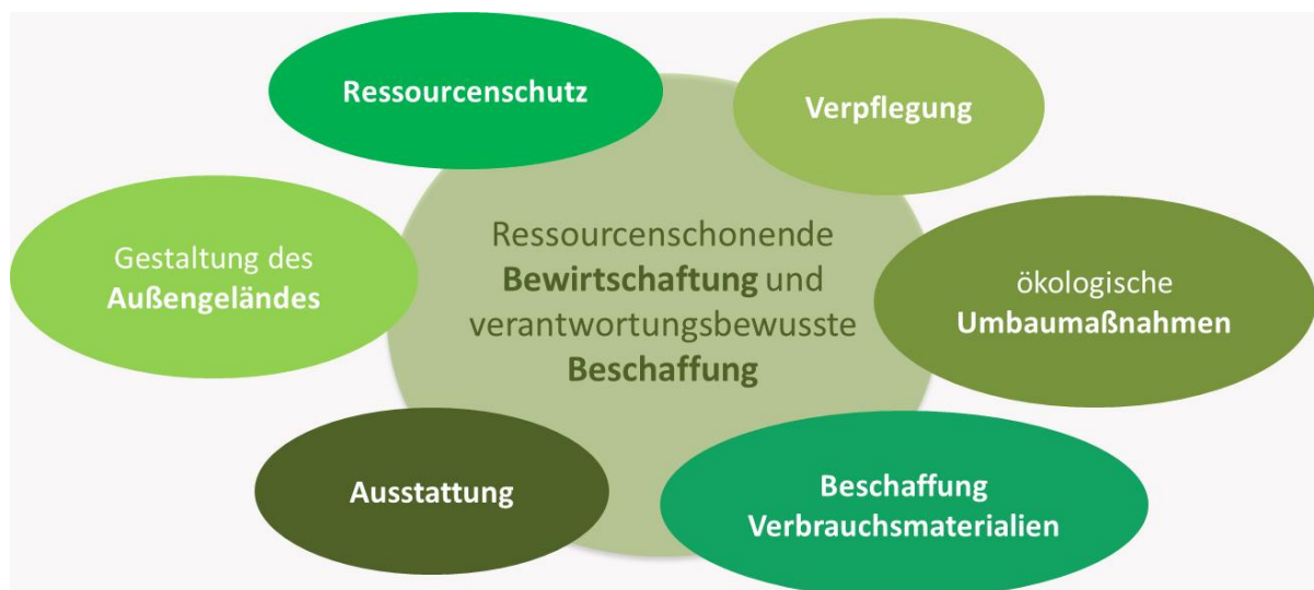
Abbildung 2: Ressourcenschonende Bewirtschaftung und verantwortungsbewusste Beschaffung (öko-fair)